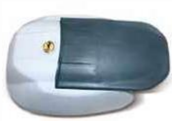
Cerradura con llave