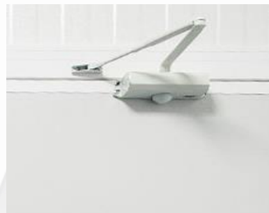
Muelle cierra puertas