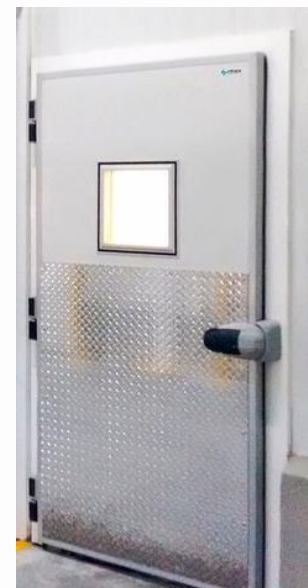
Acabado lacado + placa diamantada