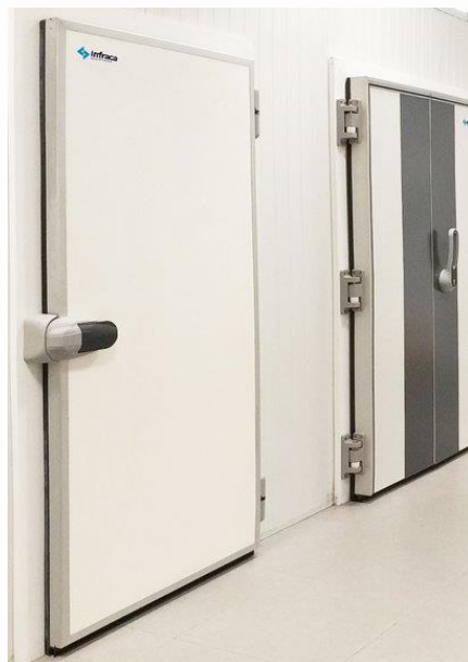
Acabado lacado / puerta doble