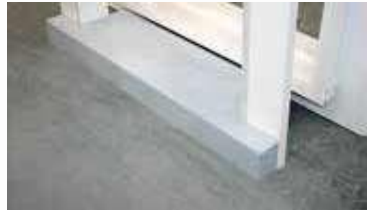
Paso carretilla sobre elevado