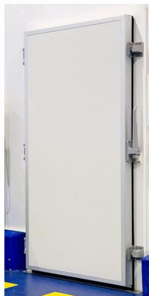
Acabado lacado blanco