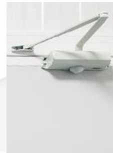
Muelle cierra puertas