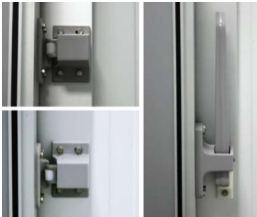
Cierre de puerta