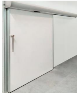
Cubre guías (superior)