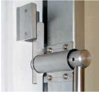
Sistema de cierre (con llave)