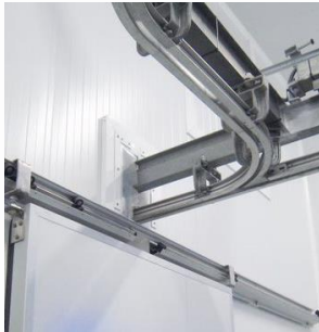
Capilla para paso aéreo