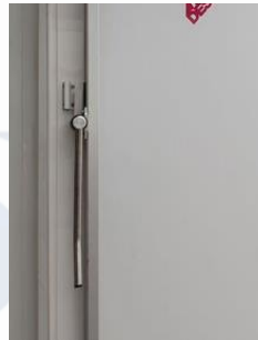
Asa de apoyo