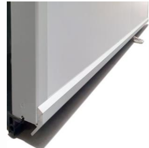
Cubre guías (inferior)