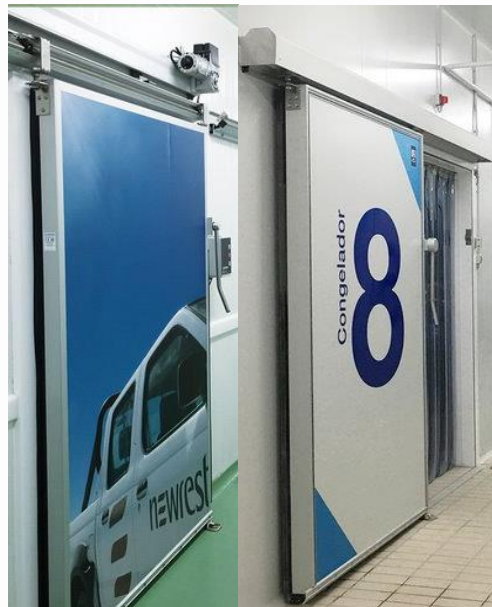
Acabados a petición del cliente