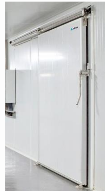
Acabado lacado blanco