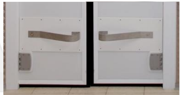
Defensa de ala de avión inoxidable