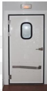
Disponible en 1 hoja