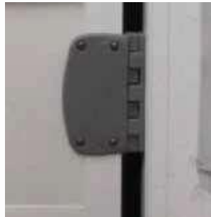
Bisagras de poliamida