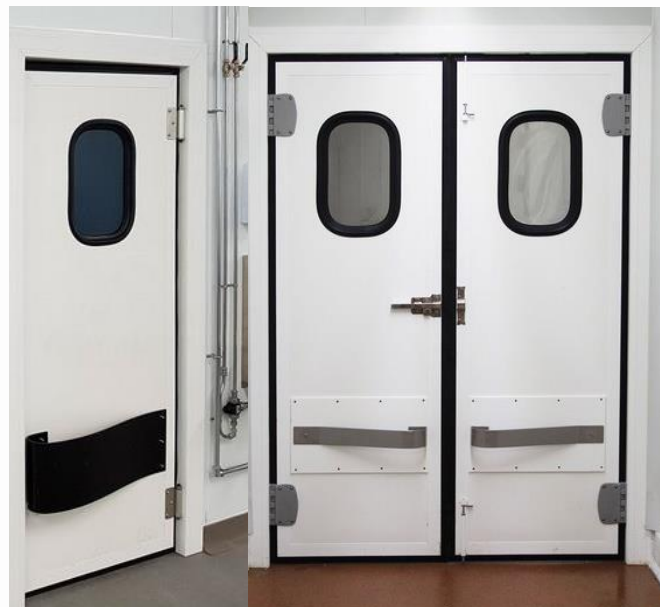
Acabado blanco lacado (2 hojas / 1 hoja)