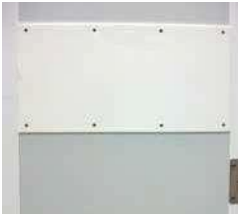
Defensa de serie