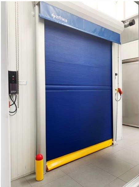
Acabado en lona azul