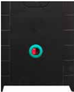
Pulsador sin contacto