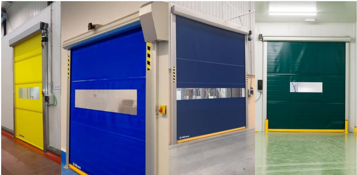
Puertas en diferentes colores de lona