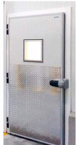
Acabado lacado + placa diamantada