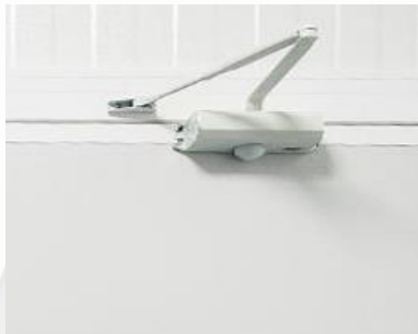
Muelle cierra puertas