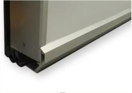
Cubre guías (inferior)