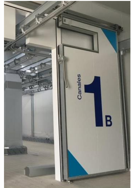
Acabado a elección del cliente