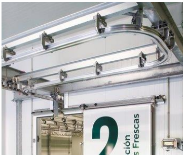
Capilla para paso aéreo