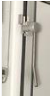
Asa de apoyo