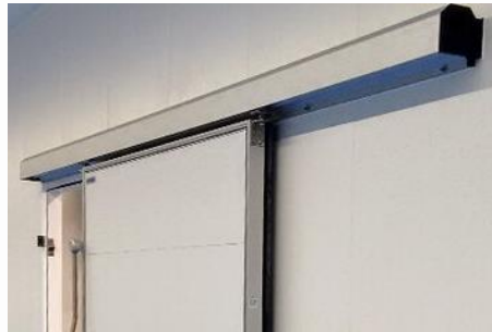
Cubre guías (superior)