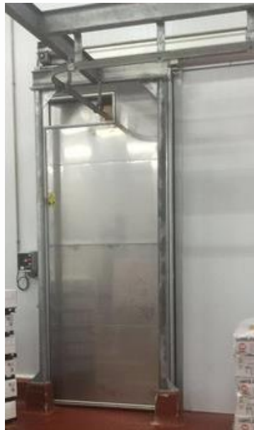
Acabado inoxidable y capilla