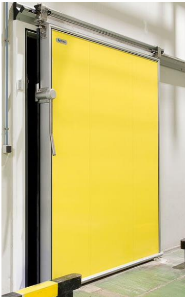
Acabado en PVC amarillo