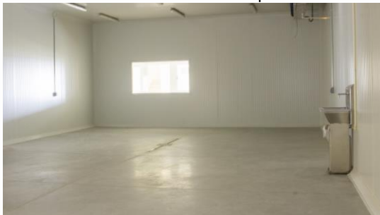
Ejemplo de espacio con concreto pulido