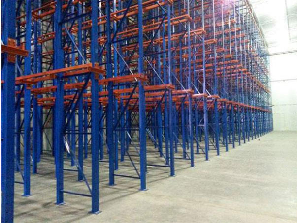
Sistema 100% modular