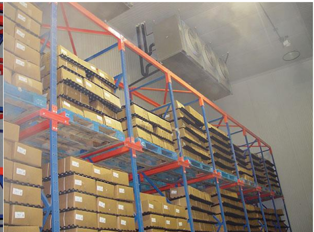
Uso en condiciones de temperaturas extremas