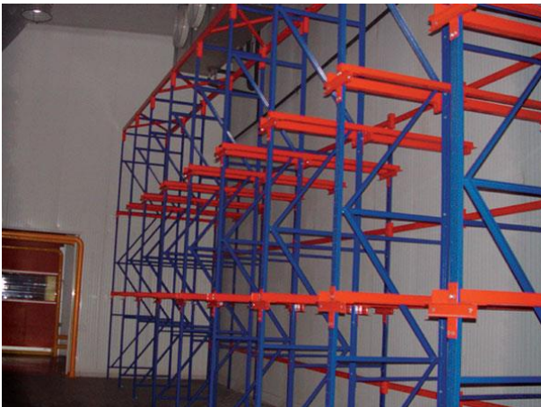
Sistema en acero estructural