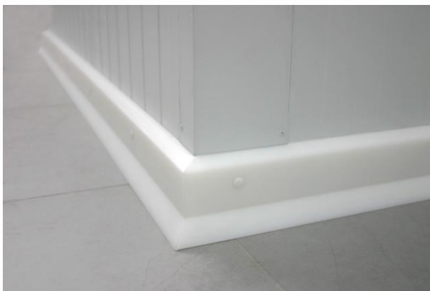
Detalle de unión de dos piezas de zoclo.

*Consultar con IDEA SH otras medidas/acabados específicos de los dados en la tabla