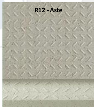
Estructura de la superficie